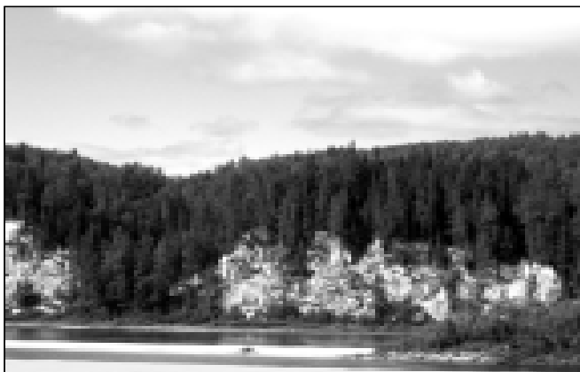
Берег реки Пинега.

Эта небольшая, но очень легко разрушаемая территория требует бережного отношения и должна быть сохранена для будущих поколений.