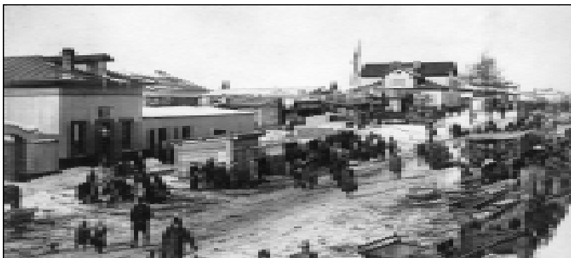
Ярмарка в Пинеге, начало XX в.